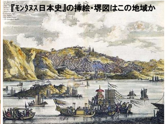
『モンタス日本史』の挿絵・堺図はこの地域か