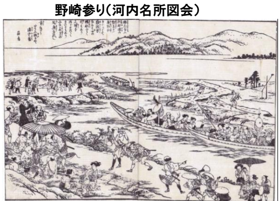
野崎参り(河内名所図会)